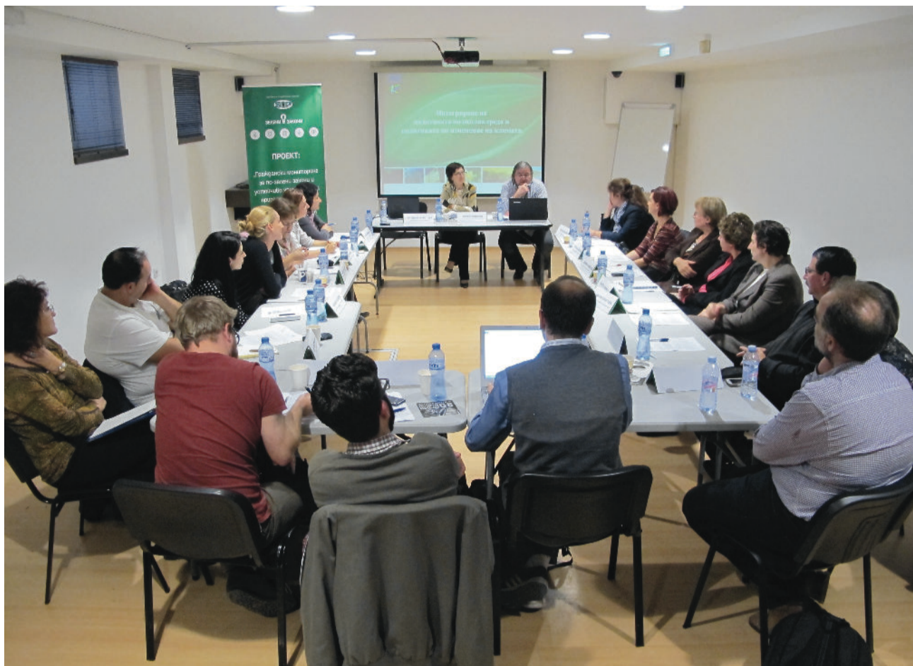
Работна среща "ПИК и ПОС - ефективни „горизонтални“ инструменти за използване на еврофондовете през периода 2014-2020 г.", 20.10.2015 г.

посолството на Р Франция у нас - с организирането на цикъла "PARIS CLIMAT 2015 - COP21".