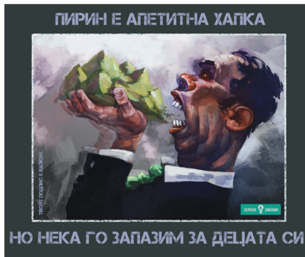
Визуализация на Фейсбук кампанията