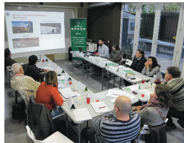
Работна среща "Българската позиция във фитнес чека на ЕС за Директивите за птиците и местообитанията", 09.11.2015 г., зала Г-8

С наближаване на ключовото в най-широк смисъл международно събитие - годишната среща на върха по Рамковата конвенция на ООН по изменение на климата (COP21, 30 ноември - 11 декември 2015 г., Париж, Франция), климатът очаквано бе сред водещите теми в дневния ред на разнообразни прояви на всякакви нива през последните месеци. Въпреки трагичните събития в Париж на 13 ноември т.г., френският министър на външните работи Лоран Фабиус, който ще председателства COP21, декларира на 16 ноември, че работата