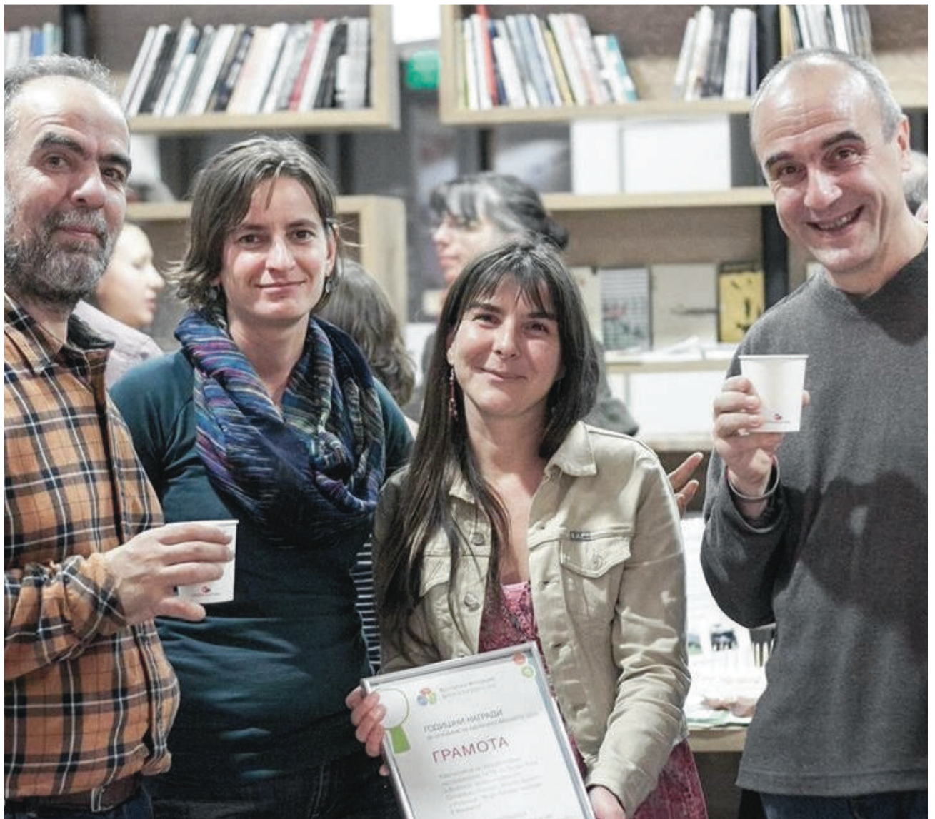
Награда за „Най-успешна кампания, свързана с опазване на биоразнообразието“, 26.11.2015 г.

Пред експерти на МОСВ и МРРБ бяха представени предложения на НПО за законодателни промени. Припомняме, че държавата вече близо 3 години отказва да измени ЗУТ в отговор на задълженията на България към Орхуската конвенция. В същото време този закон се променя ежегодно с най-различни мотиви.